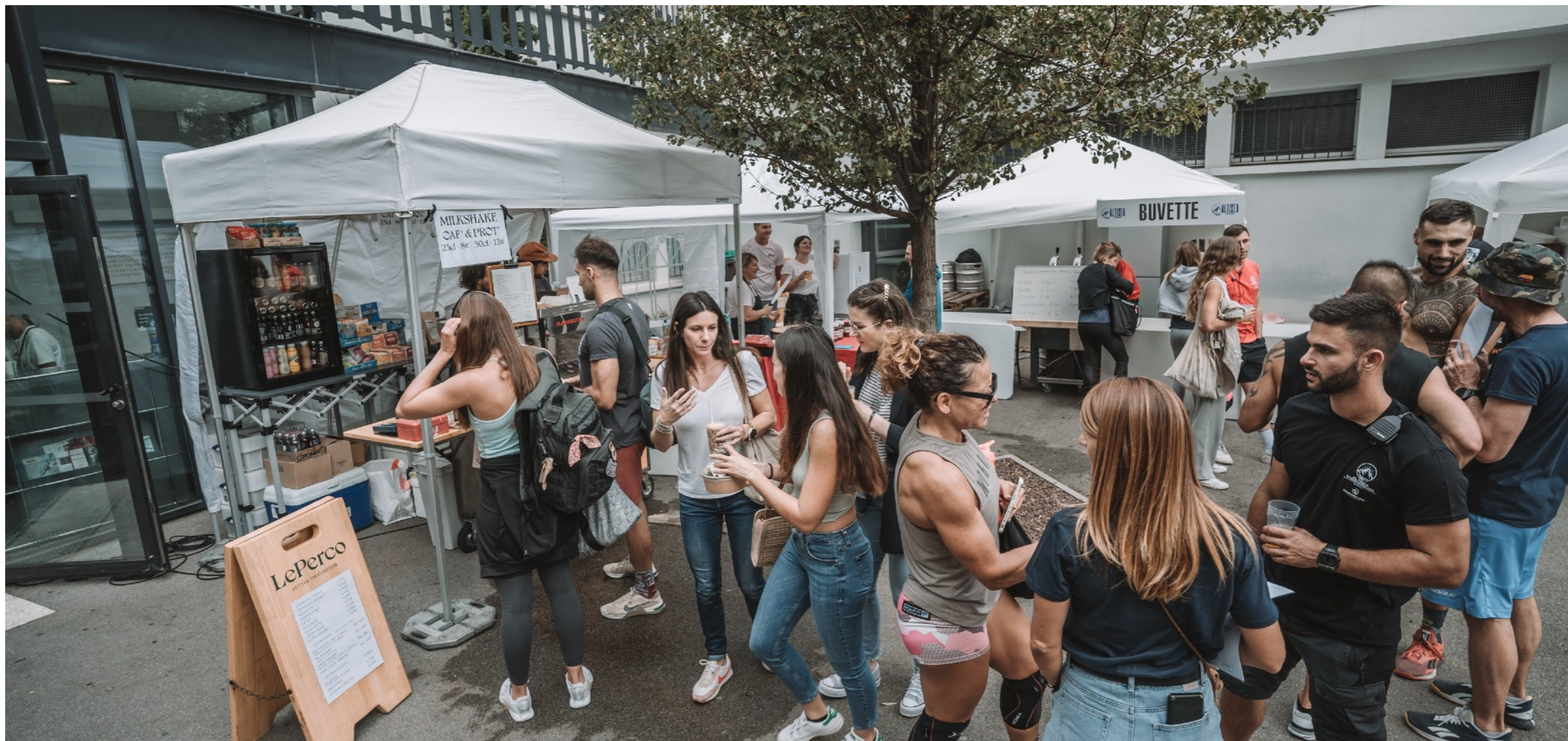
Village Partenaire Lors des Altisea Throwdown 2022

Louez nos barnums pour vos Buvettes / Stand Token / Village Partenaire.